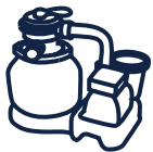
Groupe de filtration YZAKI 8,3m 3 /h